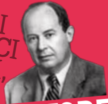
John von Neumann

CHIUNQUE CONSIDERI I METODI ARITMETICI PER PRODURRE CIFRE CASUALI, È NATURALMENTE, NELLA CONDIZIONE DI PECCATORE.